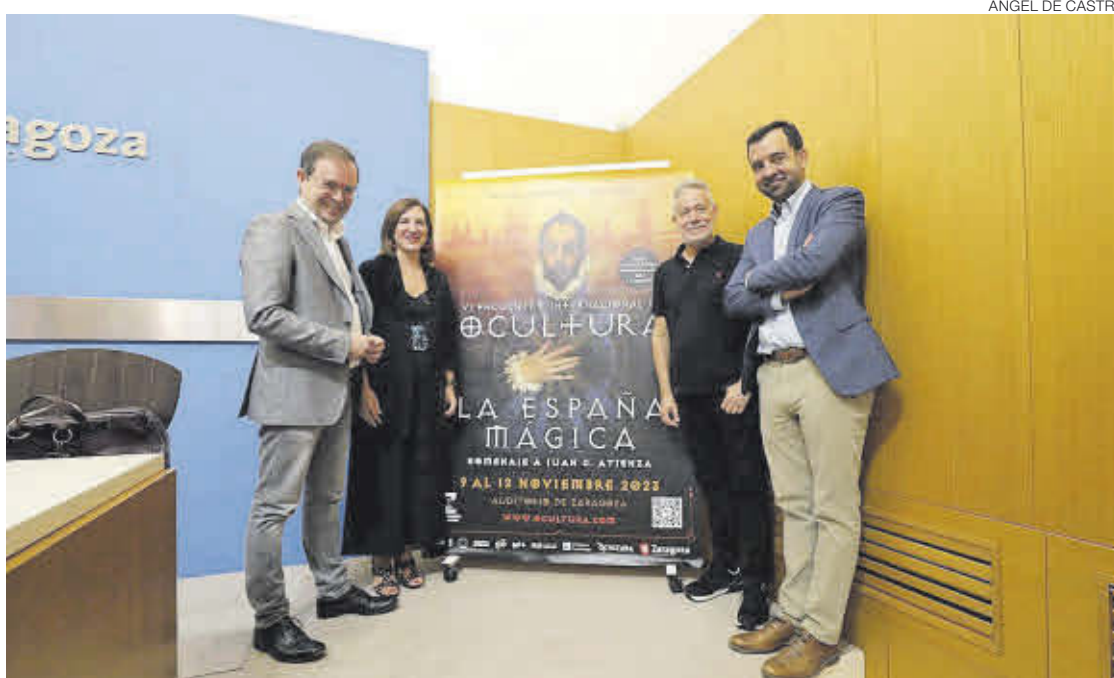
Presentación de la sexta edición de Ocultura, ayer, en el Ayuntamiento de Zaragoza.

De esta forma, el jueves 9 de noviembre se inaugurará la jornada con la sesión Los pueblos malditos de Dolores Redondo. La autora conversará sobre cómo el recuerdo de las persecuciones a brujas y agotes penetró en su célebre Trilogía del Baztán, adaptada al cine y traduci-