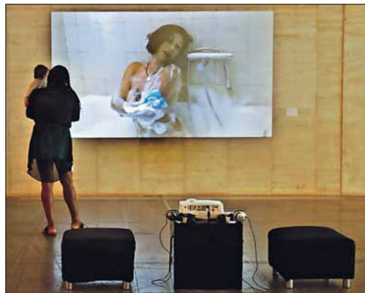
Tres exposiciones del museo se cerrarán en dos semanas. RAMIRO

la entrada al museo será gratuita en horario de 11.00 a 15.00 y de 17.00 a 21.00 horas, y se ofrecerán visitas guiadas a las exposiciones a las 18.00 y 19.30 horas. Hasta su clausura, las exposiciones pueden visitarse en el horario habitual del museo, de martes a viernes 11.00 a 14.00 y de 17.00 a 20.00 horas, y fines de semana de 11.00 a 15.00 y de 17.00 a 21.00. Además, la entrada al museo es gratuita de 19.00 a 20.00 de martes a jueves, así como los domingos por la tarde.